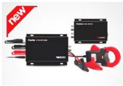
DH2000 便携式变频电量分析仪

前端数字化_复杂电磁环境下的高精度测量解决方案 不同功率因数下相位误差对功率测量准确度的影响 幅值对测量准确度的影响？ 准平均值真的可以替代基波有效值吗？