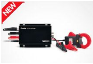
DH2000 便携式变频电量分析仪

——对部分术语和定义的表述做了修改（见 461-01-02、461-01-07、461-02-01、461-02-08、461-03-01、461-05-09、461-05-11、461-10-10、461-11-14、461-17-16、461-22-01、461-23-01、461-23-02）。