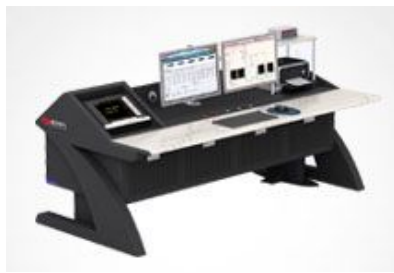
电机试验台典型案例

前端数字化_复杂电磁环境下的高精度测量解决方案 不同功率因数下相位误差对功率测量准确度的影响 幅值对测量准确度的影响？ 准平均值真的可以替代基波有效值吗？